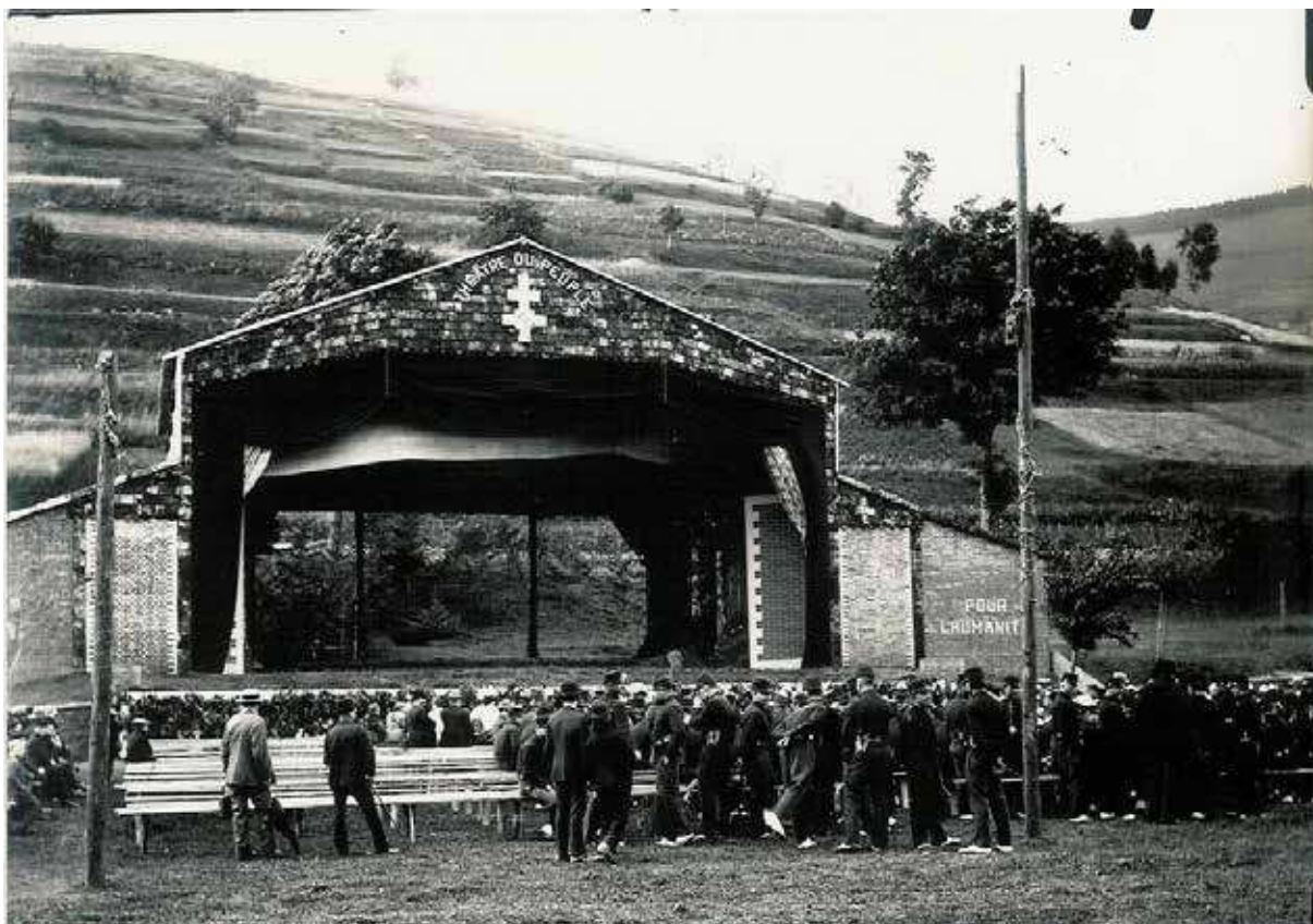
THÉÂTRE DU PEUPLE 1896