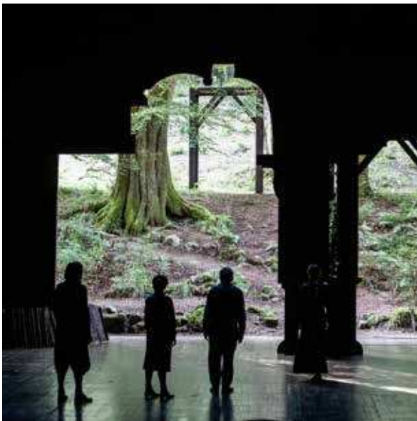
LE CONTE D'HIVER DE WILLIAM SHAKESPEARE, MISE EN SCÈNE JULIE DELILLE, 2024 © JEAN-LOUIS FERNANDEZ

L'ouverture du fond de scène sur la colline arborée est aujourd'hui un moment incontournable de la représentation pour les spectateur·ices comme pour les artistes qui viennent créer à Bussang. Quand les portes s'ouvrent, le monde et le théâtre se mêlent, et l'art se voit transfiguré par son contact avec la nature. Dès les origines, Maurice Pottecher, dans le sillage wagnérien, voit dans ce dispositif unique un moyen de régénérer le théâtre de son temps et de lui rendre son « authenticité », en référence au mythe grec. Par ailleurs, le bâtiment qui étonne aujourd'hui tous les visiteurs et visiteuses de ce lieu s'est construit progressivement, avec l'aide des entreprises locales, passant d'un simple cadre délimitant le paysage dans le pré attenant à la propriété familiale, à un théâtre-chalet, tout de bois, classé Monument historique en 1976. Des travaux sont entrepris régulièrement avec le plus grand respect.