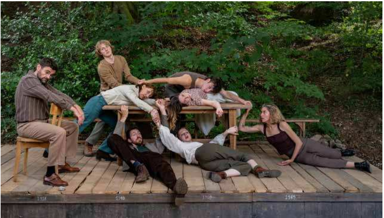
HÉRITER DES BRUMES © JULIE DUBIER, VINCENT ZOBLER