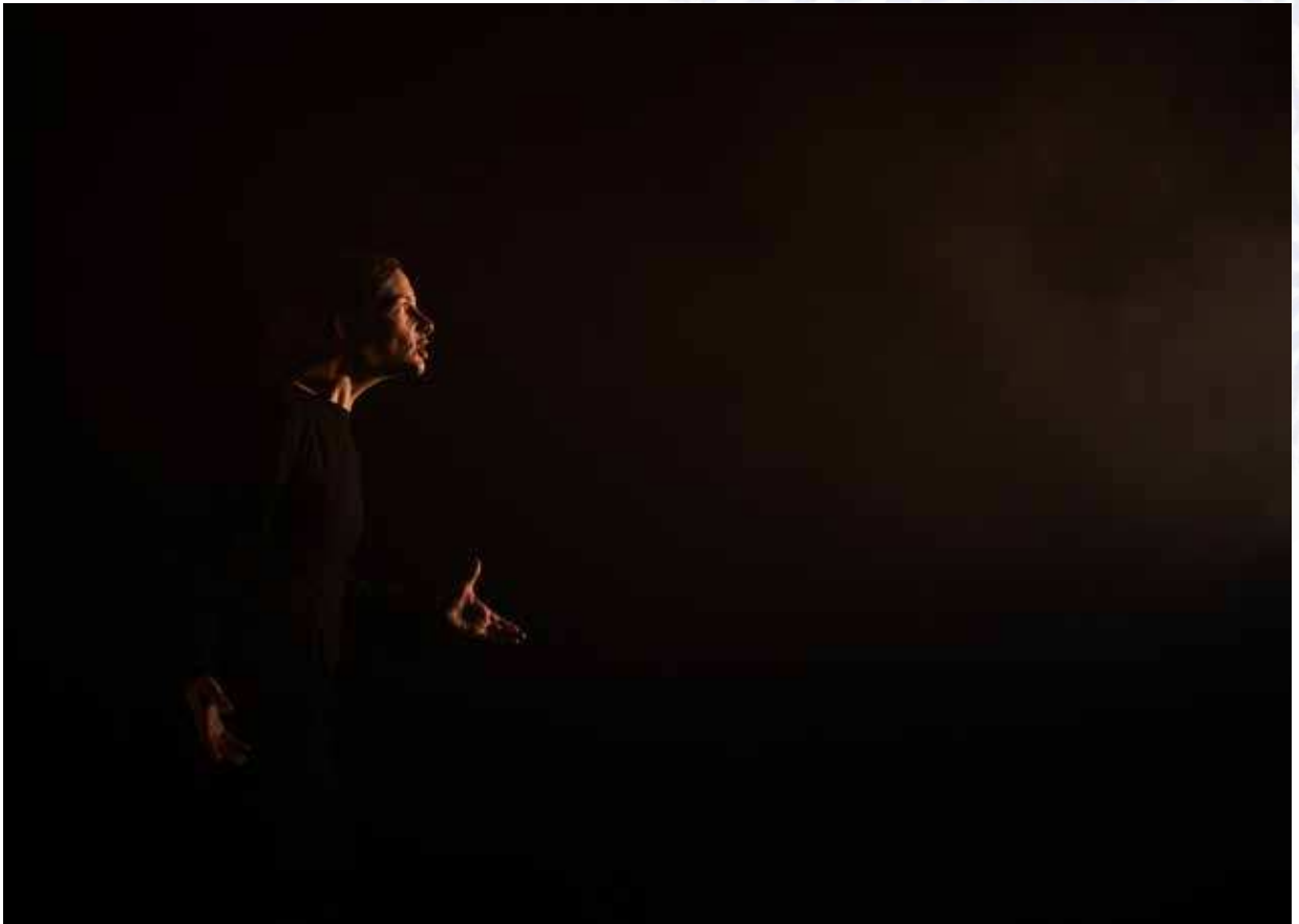
JE SUIS LA BÊTE D'ANNE SIBRAN, MISE EN SCÈNE JULIE DELILLE