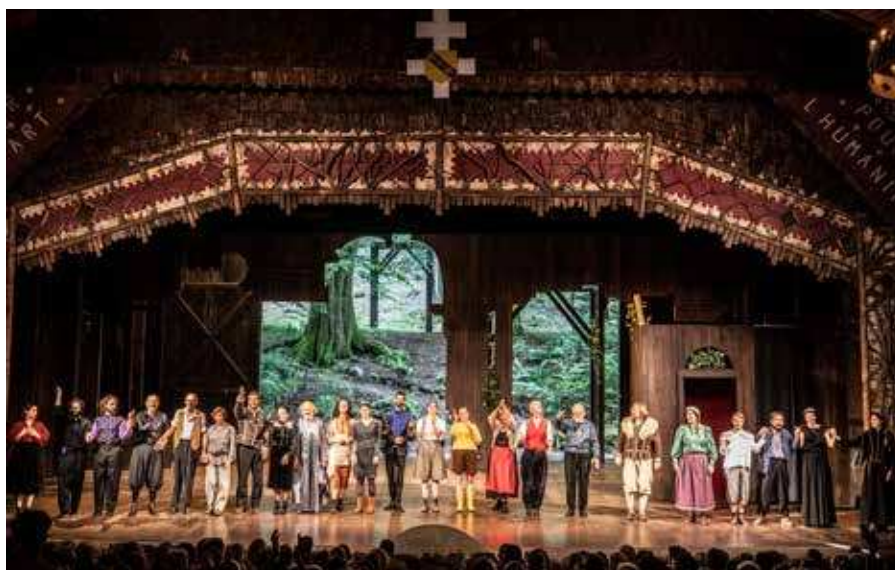
LE CONTE D'HIVER DE WILLIAM SHAKESPEARE, MISE EN SCÈNE JULIE DELILLE, 2024 © JEAN-LOUIS FERNANDEZ