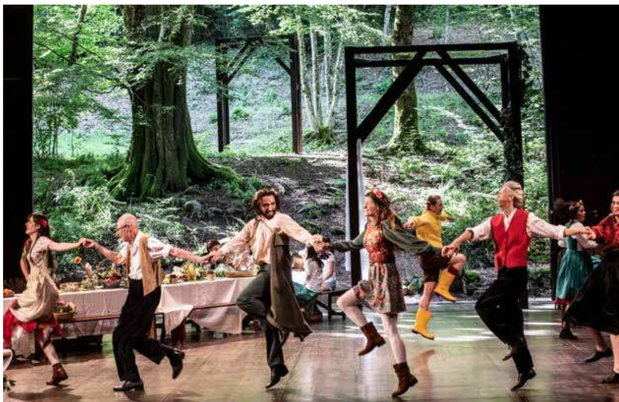
LE CONTE D'HIVER DE WILLIAM SHAKESPEARE, MISE EN SCÈNE JULIE DELILLE, 2024

Dans ce lieu à la temporalité unique, la notion de saisonnalité, et celle de territoire trouvent tout leur sens. Pour poursuivre cette utopie audacieuse, il s'agit de porter ensemble l'expérimentation artistique, le lien aux œuvres de l'esprit et l'échange comme valeurs essentielles.