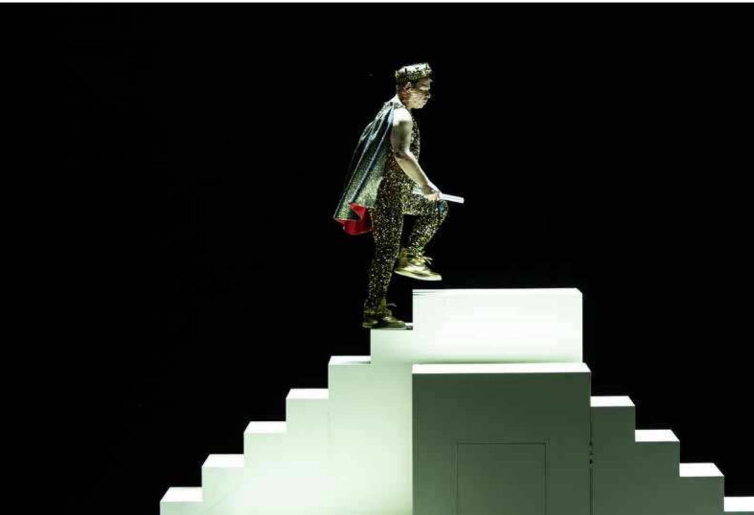
LE ROI NU D'EVGUENI SCHWARTZ, MISE EN SCÈNE SYLVAIN MAURICE, CRÉATION 2025